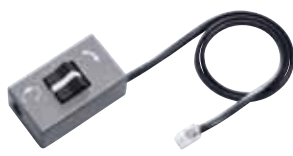
ヘッドセット/ハンドセット切替スイッチ