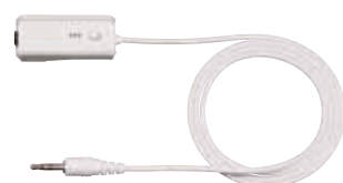
PHS用2.5φ・3極ピンコード