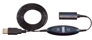
USBヘッドセットアダプタ