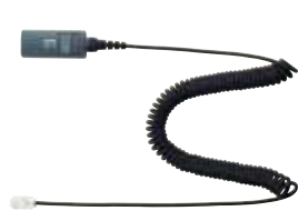
無極性ミュート付カールコード

コード エンタープライズシリーズではさまざまな運用シーンに合わせて豊富なコード類をご用意しております