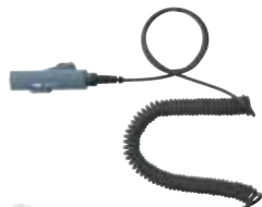
無極性ボリューム・ミュート付カールコード