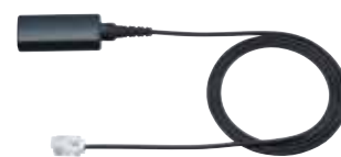
プレステル/S21用ストレートコード