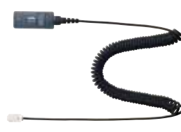
AVAYA CMV・Cisco(一部)用 無極性ミュート付カールコード