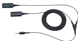
モニタリングYコード