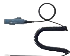
AVAYA CMV・Cisco(一部)用 無極性ボリューム・ミュート付カールコード